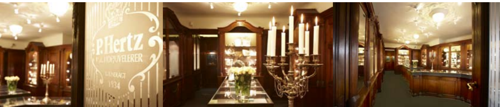
Forretningens interiør som det tager sig ud i dag